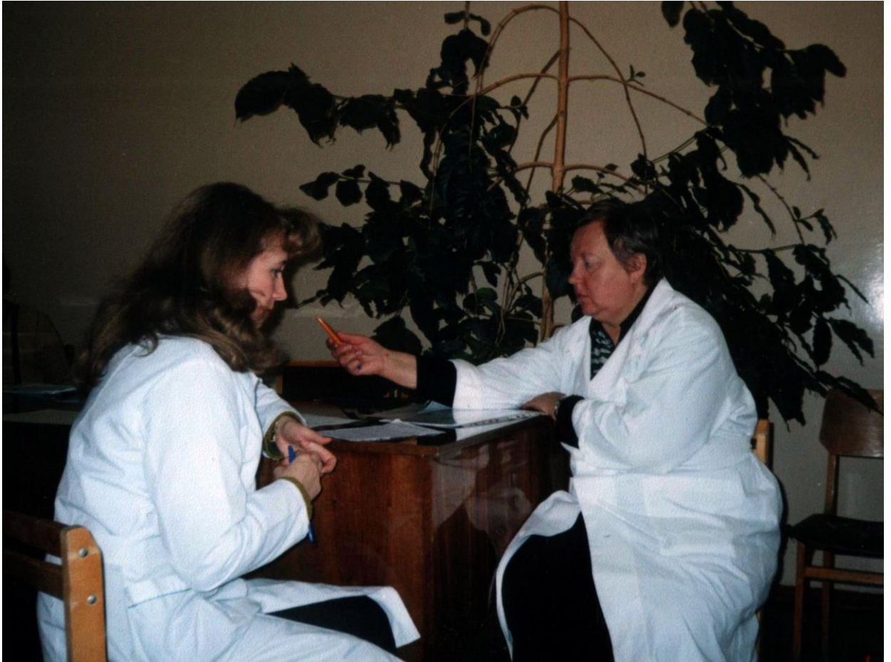
Собеседование на сертификационном экзамене акушерок родильных домов (2005 г.)