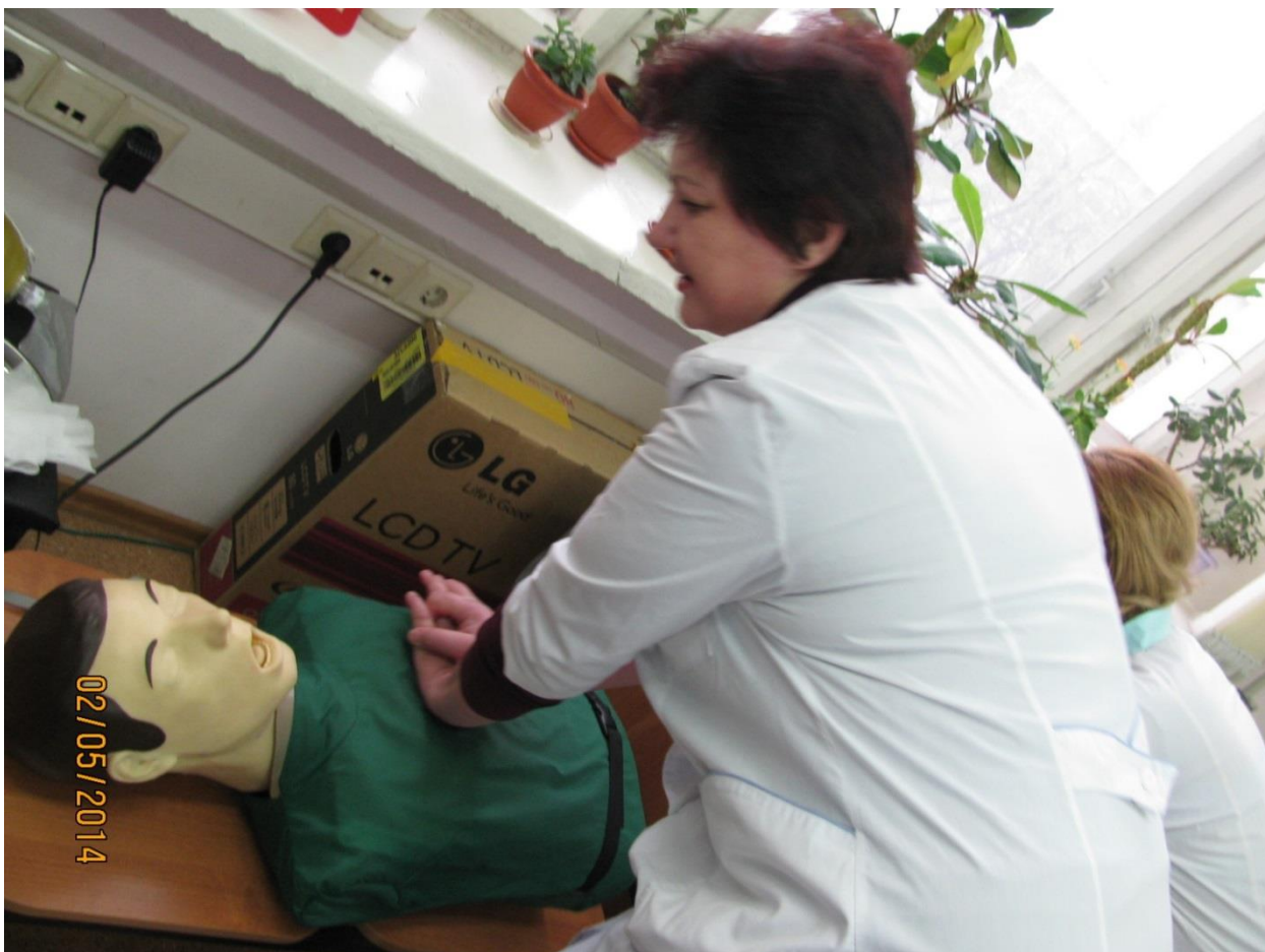
На практическом занятии в ЦНППО. Сердечно-легочную реанимацию проводят медицинские сестры детских поликлиник (2014 г.)