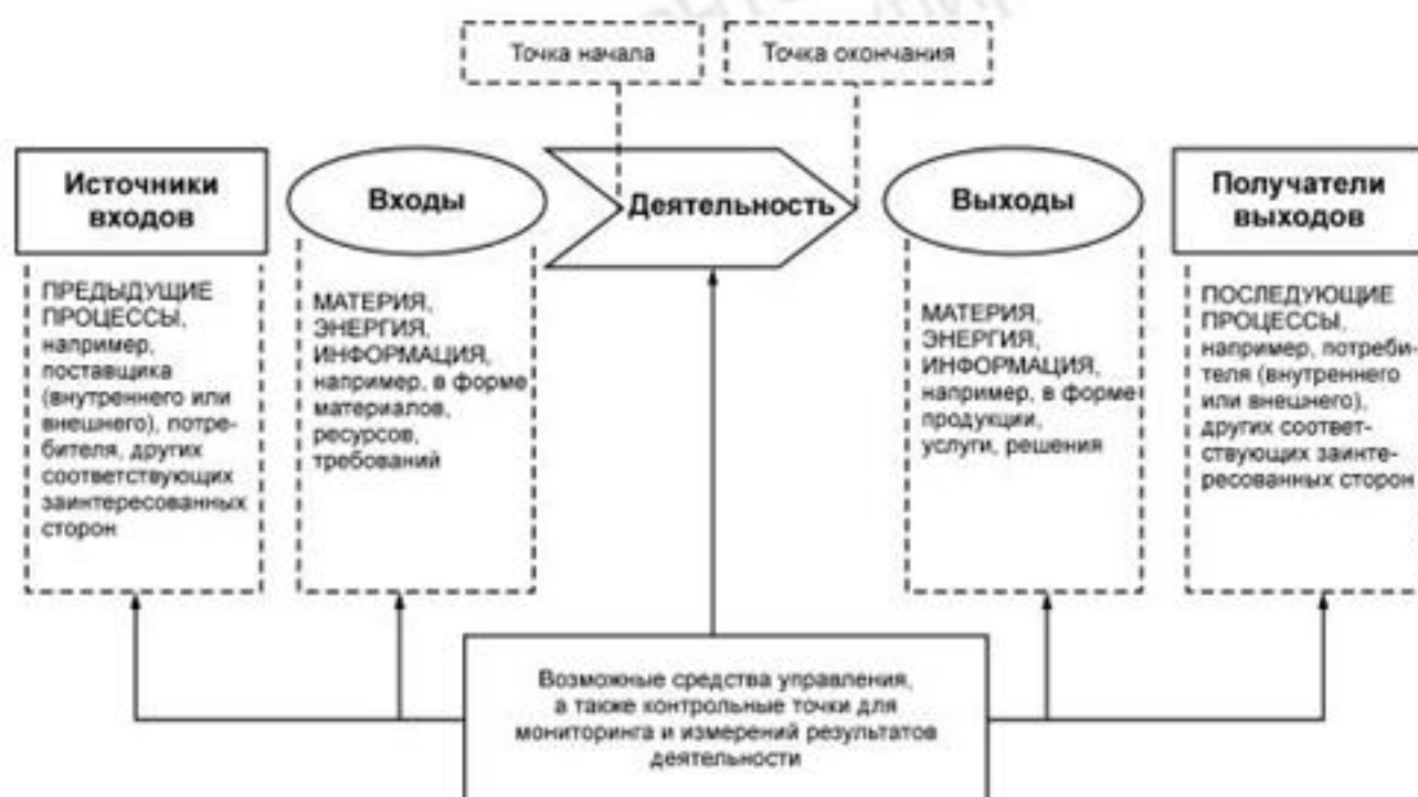
Рисунок 1 — Схематичное изображение элементов процесса

Рисунок 1 дает схематичное изображение любого процесса и иллюстрирует взаимосвязь элементов процесса. Контрольные точки мониторинга и измерения, необходимые для управления, являются специфическими для каждого процесса и будут варьироваться в зависимости от соответствующих рисков.