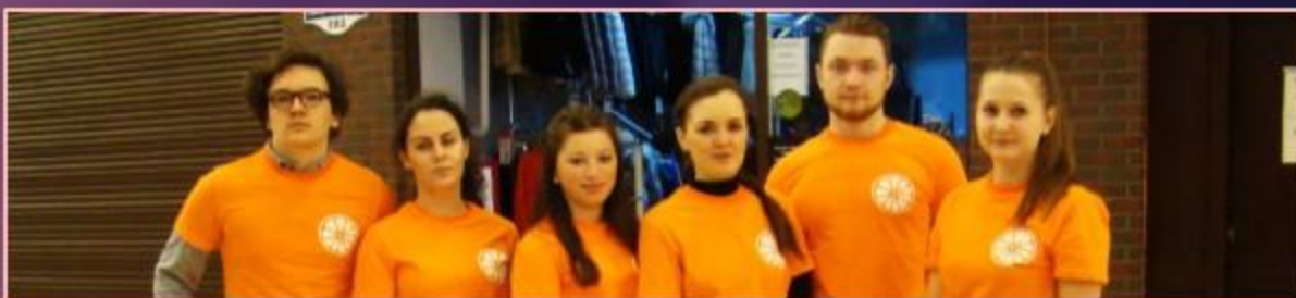
Городской благотворительный марафон помощи детям с ограниченными возможностями здоровья «Ты нам нужен!»