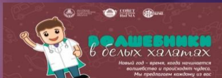
«Волшебники в белых халатах»