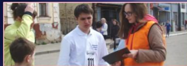
День города Иваново, молодежный арт-арбат