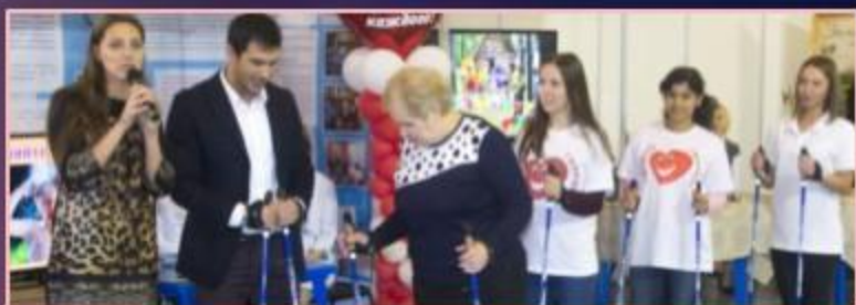
Межрегиональная выставка «Медицина и здоровье»