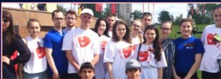
Медицинское сопровождение на Параде Победы