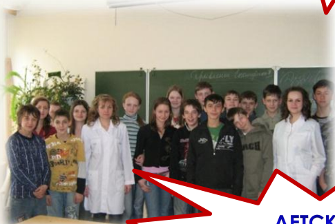
ДЕТСКИЕ САДЫ И ШКОЛЫ