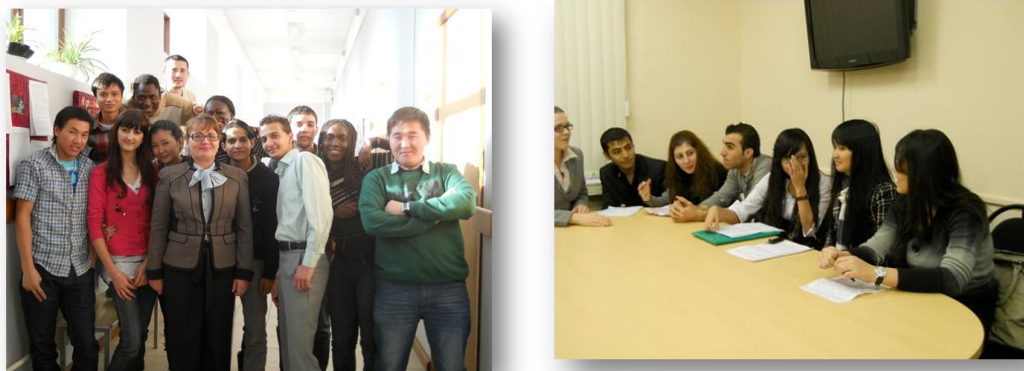
Рис. 10. Участники клуба интернациональной дружбы