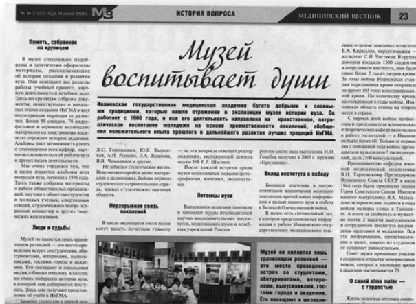
Рис. 16. Статья в газете "Медицинский вестник" (11.06.2010) о музее истории ИвГМА