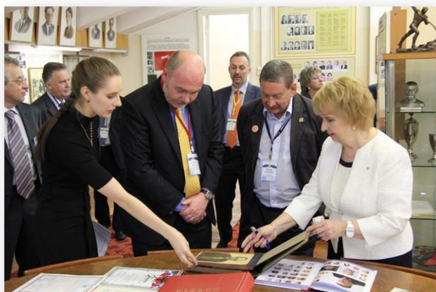
Рис. 15. Гости академии из графства Стэффордшир знакомятся с историей ИвГМА

Гости музея среди экспонатов видят почетную грамоту Президиума Верховного Совета РСФСР, Благодарность Президента РФ В.В. Путина за трудовые достижения в области здравоохранения, многолетнюю плодотворную научную, педагогическую и врачебную деятельность. Из других документов посетители узнают о присужденной вузу международной премии «Профессия – жизнь», международной награде «Эртемейкер» в номинации «За сохранение и развитие интеллектуально-кадрового потенциала предприятия в период переходной экономики» и других знаках отличия, полученных ИвГМА.