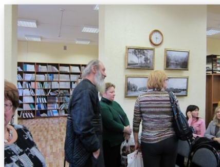
Рис. 20. Выставка работ художественной фотографии Петра Сургучёва (библиотека ИвГМА)