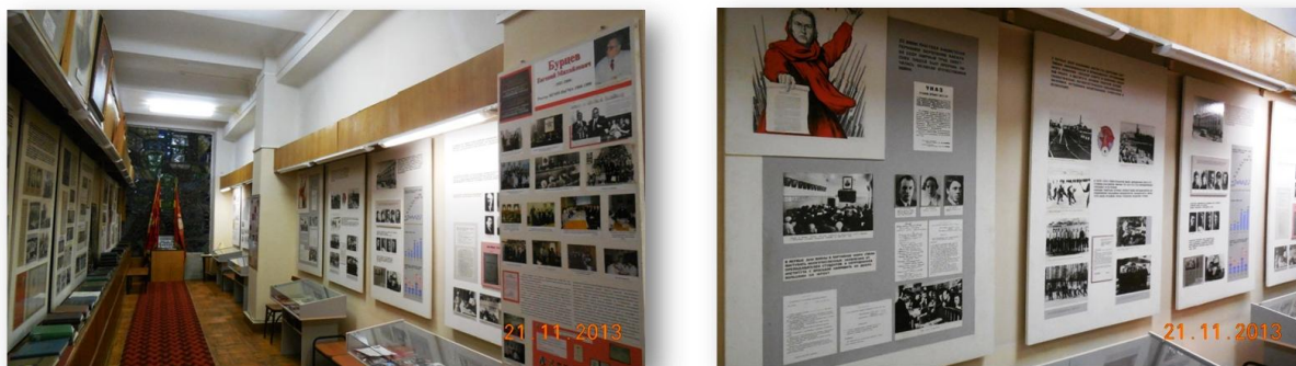
Рис. 17. Экспозиции музея, посвященные Великой Отечественной войне