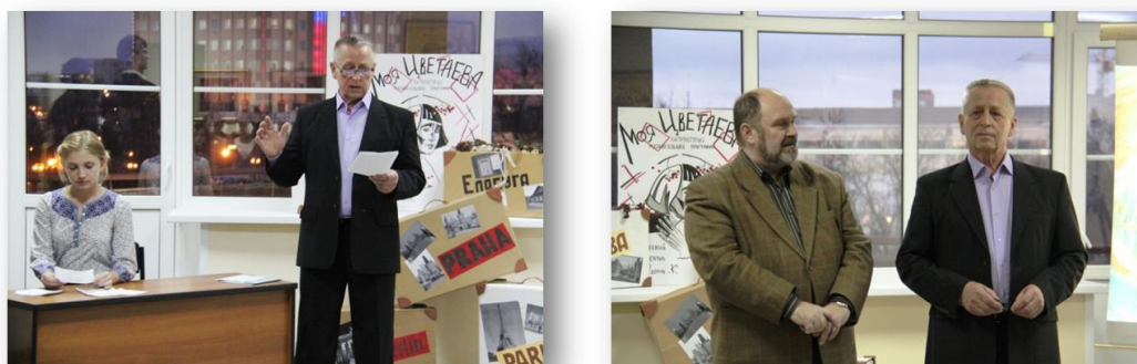
Рис. 18. Выступление коллектива «Федоров и К о » в зале Ивановского филиала Российского фонда культуры

П. Мероприятия, связанные с эстетическим, общекультурным и патриотическим воспитанием. Пропаганда российской культуры.