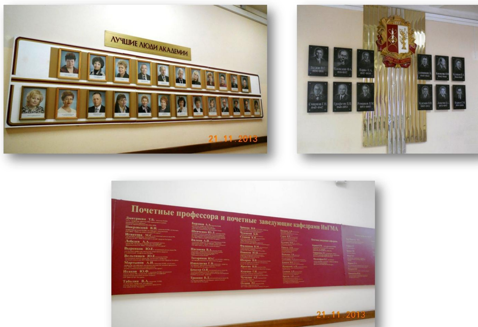
Рис. 9. Стенды «Лучшие люди академии», «Ректоры ИГМИ и ИвГМА», «Почетные профессора академии и Почетные заведующие кафедрами»

Воспитывать чувство гордости за свой вуз, вырабатывать ощущение корпоративного единства помогают также стенды: «Лучшие люди академии», «Ректоры ИГМИ и ИвГМА», «Почетные профессора академии и Почетные заведующие кафедрами» и др.