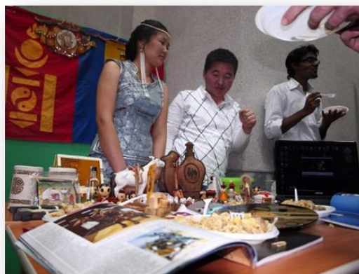
Рис. 5. Международный день студента в ИвГМА