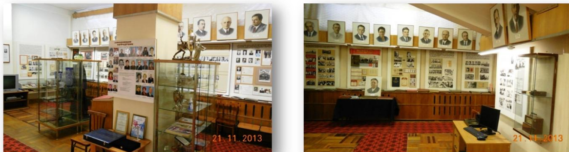
Рис. 12. Экспозиции музея истории ИвГМА

положительного опыта прошлого и дальнейшего развития лучших традиций вуза. В музее специально подобраны и эстетически оформлены материалы, которые рассказывают об истории создания и развития вуза. Они освещают все разделы работы: учебный процесс, науку и лечебное дело. Здесь по крупицам собраны документы, повествующие о начальных этапах создания вуза и всех последующих периодах его развития.