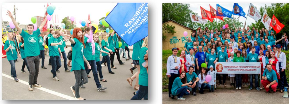
Рис. 4. День города (2013 г.)

В Иванове такое шествие организуется в День города (последняя суббота мая), в котором постоянно принимают участие обучающиеся, преподаватели и сотрудники ИвГМА. В костюмах и реквизите присутствует атрибутика вуза – флаг, футболки, бейсболки и пр. с логотипом академии.