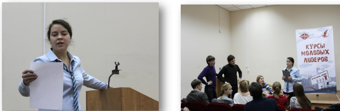
Рис. 7. Дебатный турнир

Конкурсы и олимпиады – форма работы по патриотическому воспитанию студентов, основанная на соревновании, соискательстве нескольких лиц (или групп) в какой-либо области – знании истории и содержательного значения государственной символики Российской Федерации, знании истории, символики (гимна, герба, логотипа) академии и др. – с целью выделить наиболее выдающегося (или выдающихся) конкурсанта – претендента на победу. Направлены на закрепление и развитие знаний студентов, а также на пропаганду и популяризацию как государственных, так и академических символов в студенческой среде.