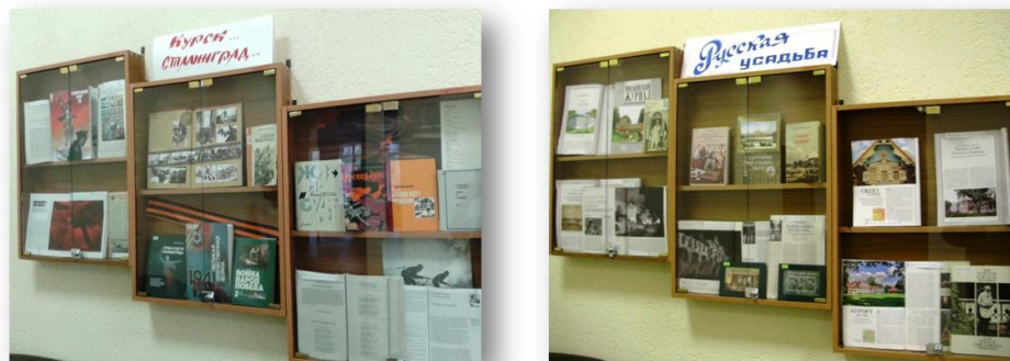
Рис. 19. Книжные выставки в библиотеке ИвГМА

Патриотическое и гражданское воспитание является частью гуманитарно-просветительской работы библиотеки ИвГМА.