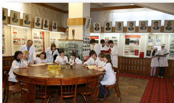
Рис. 14. Посещение студентами музея истории ИвГМА

Своими экспозициями музей воспитывает души. Никого не оставляет равнодушным студенческая работа, посвященная выпускнику ИвГМА Василию Кузнецову, погибшему в Чечне.