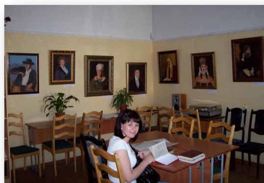
Рис. 6. Выставки на кафедре гуманитарных наук

Экскурсия – форма работы по патриотическому воспитанию, коллективное посещение музея, достопримечательного места, выставки, памятника культуры, предприятия и т. п.; поездка, прогулка с образовательной, познавательной, научной, спортивной или развлекательной целью.