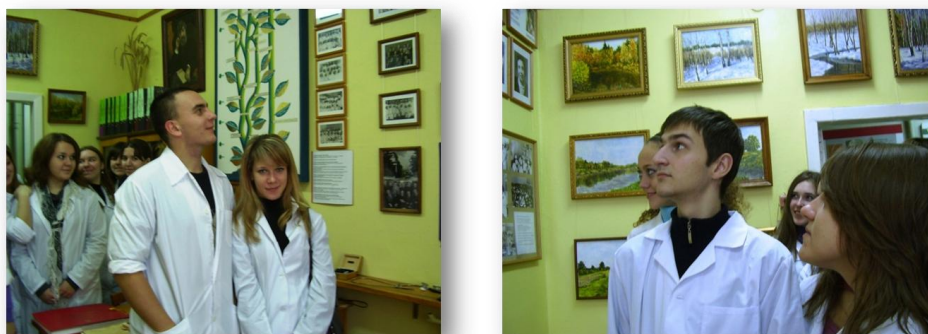
Рис. 8. Экспозиции в музее кафедры детских болезней лечебного факультета

Большой вклад в воспитание профессиональных, патриотических и корпоративных чувств студентов вносят и музеи кафедр детских болезней лечебного факультета, гистологии, анатомии.