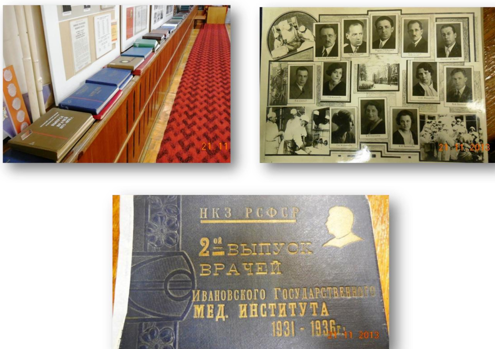
Рис. 13. Фотоальбомы выпускников ИГМИ-ИвГМА

Более 90 стендов, 80 видеофильмов и огромное количество материалов на электронных носителях отражают историю академии. Всего в настоящее время музей насчитывает около 10000 единиц хранения. Имеющиеся в музее альбомы дают возможность узнать о становлении всех кафедр, развитии научно-исследовательской работы вуза и других видов деятельности. Гордостью музея являются альбомы всех выпусков нашего вуза, начиная с 1936 года.