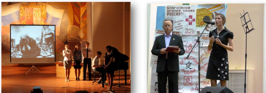
Рис. 3. Выступления коллектива "Федоров и К"

Театрализованное шествие – форма патриотического воспитания, массовое прохождение людей по заранее определенному маршруту в целях привлечения внимания. Театрализованное шествие совершается в специально установленные дни, праздники, в связи с конкретными обстоятельствами и пр. Совершается по улицам города или студенческого городка по заранее разработанному сценарию и предусматривает наличие костюмированного действия, исторических персонажей, различных атрибутов и пр. Персонажи, атрибуты, костюмы соответствуют содержанию праздника, которому посвящается шествие.