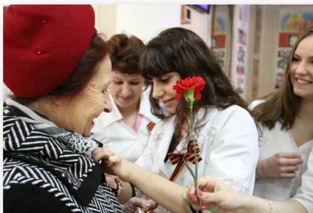
Рис. 2. Акция "Георгиевская ленточка"

Студенческая патриотическая акция (лат. actio – действие, выступление, предпринимаемое для достижения какой-либо цели (например, политическая акция) – форма работы по патриотическому воспитанию, ставящая целью формирование гражданственности, патриотизма, социальной активности. Акция может включать: официальную часть, торжественный митинг; выступления официальных лиц, руководства вуза, представителей молодежных организаций города, вуза; массовое исполнение государственного гимна; массовое шествие; концерты; спортивные состязания; танцевальные шоу, дискотеки; праздничные фейерверки и пр. В Иванове традиционными стали такие акции, как: "Георгиевская ленточка", "Бессмертный полк".