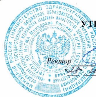
График одобрен Ученым советом вуза Протокол № 6 от 28.06.2018