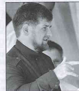
Президент Чечни Рамзан Кадыров держит слово: тех, кто не сложил оружие, он уничтожает

В чем теперь должны быть уверены сепаратисты, готовящие, например, захват заложников?