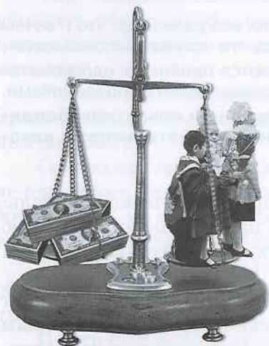
Мерзости совершаются по твердым ценам

Нормальные люди убеждены: не может быть таких идей и целей, которые объясняли бы захват и подрыв школы с детьми, пришедшими на праздник 1 сентября. И что это за идея такая, если она заставляет стрелять в спины бегущих и ползущих первоклашек?