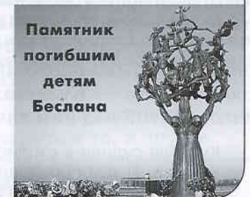
Памятник погибшим детям Беслана

Так почему же террористов называют словом «нелюди»?