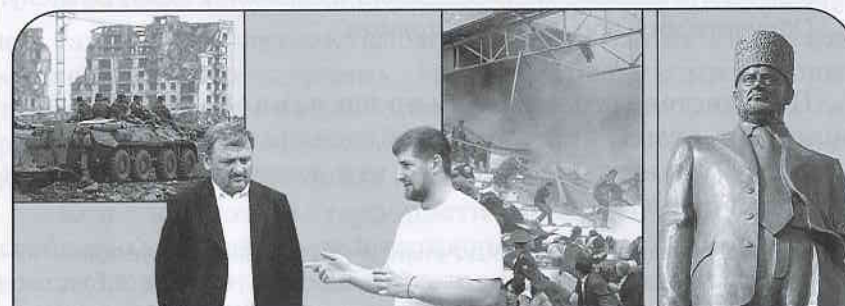
Так выглядел Грозный в 1995 году

И Ахмад Кадыров в 2005 году был убит террористами во время праздничного парада ко Дню Победы на стадионе в Грозном. За что? Он срывал их планы.