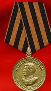
Медаль «За победу над Германией в Великой Отечественной войне 1941–1945 гг.»