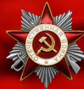
Орден Отечественной войны II степени