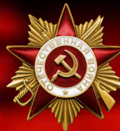
Орден Отечественной войны I степени