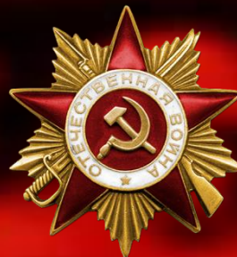
Орден Отечественной войны I степени