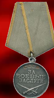
Медаль «За боевые заслуги»