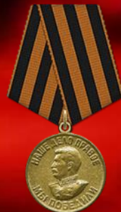
Медаль «За победу над Германией в Великой Отечественной войне 1941–1945 гг.»