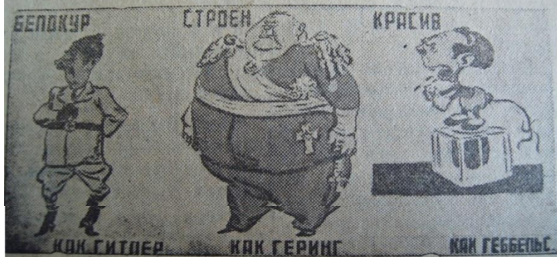
Рисунок Б. Ефимова (Окно ТАСС № 22).

Согласно фашистской расовой теории истинный арийец должен быть: