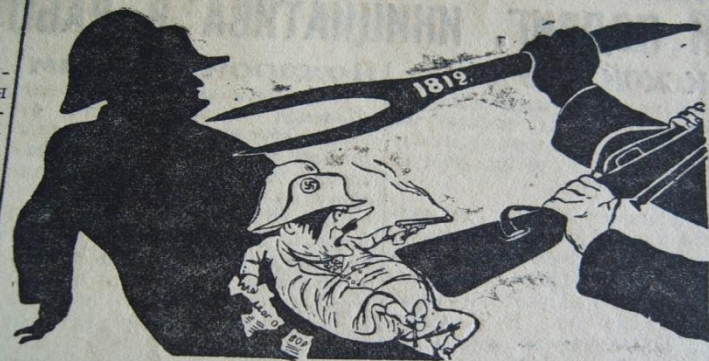
Наполеон потерпел поражение, то же будет с зазнавшимся Гитлером!

Рисунок художника Кукуриниксы (Репродукция с плаката, выпущенного издательством «Искусство»).