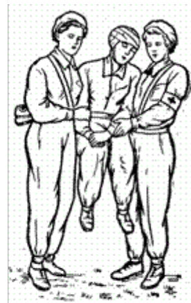
Рис. 71. Переноска на лямке двумя носильщиками