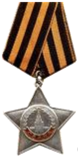
Орден Славы III степени.