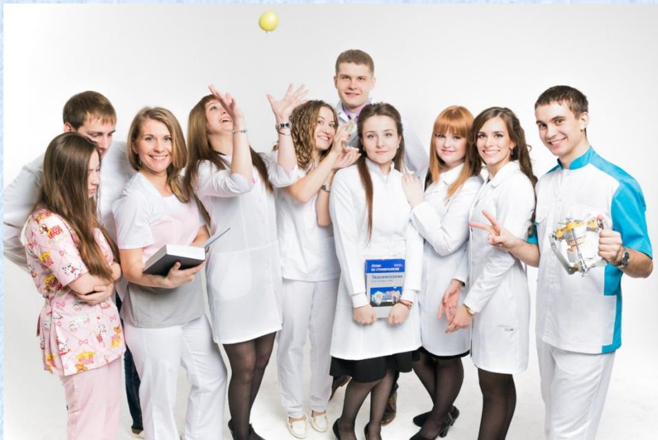
Лучшая группа ИвГМА - 2015