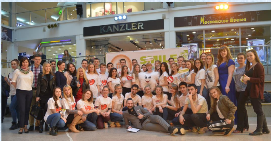
День стоматологического здоровья - 2017