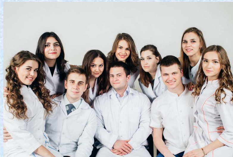
Лучшая группа ИвГМА - 2017