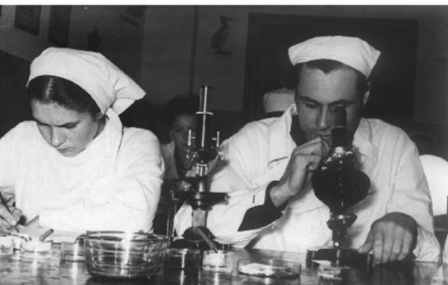
Студенты на практических занятиях по биологии