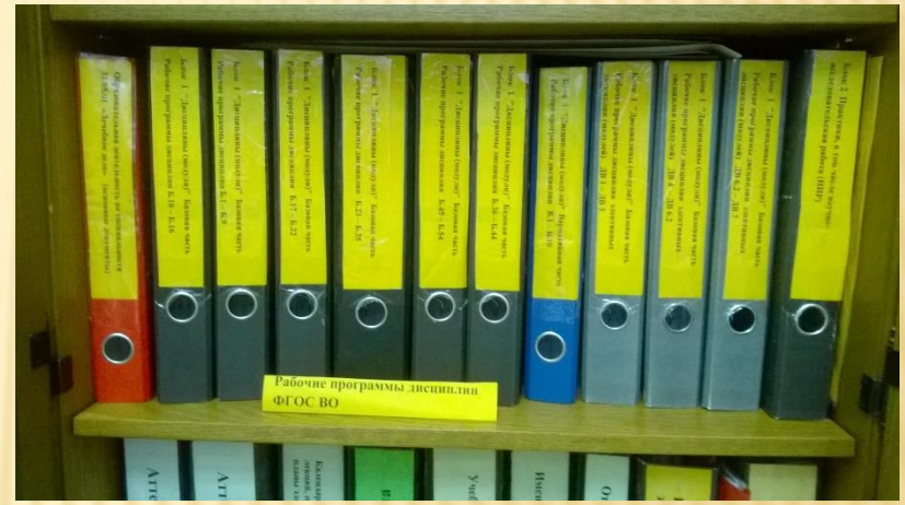
Рабочие программы дисциплин специальности 31.05.01 «Лечебное дело» ФГОС. ВО с приложениями