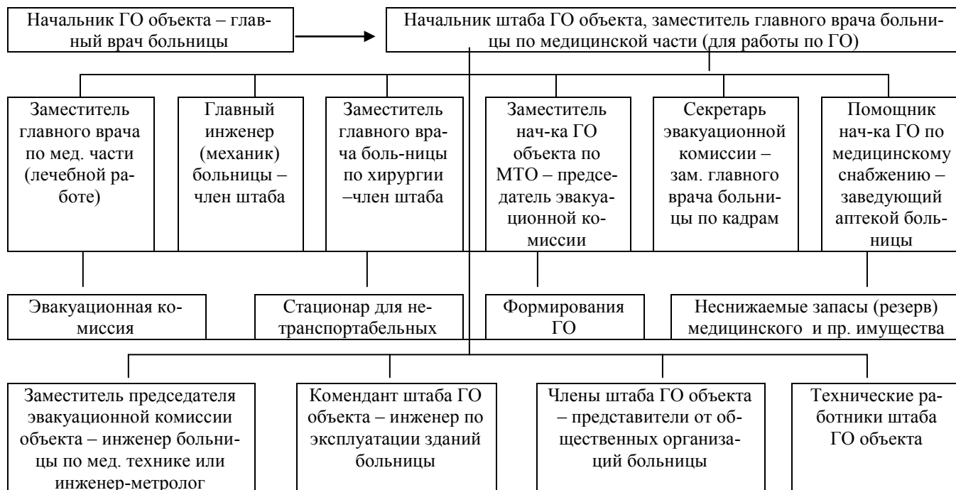
Схема организации штаба ГО больницы (вариант)

Функциональные обязанности отрабатываются каждым должностным лицом штаба ГО объекта под руководством начальника штаба, обсуждаются на заседании штаба, подписываются исполнителем и начальником штаба и утверждаются начальником ГО объекта. Первый экземпляр документа с указанием функциональных обязанностей должностных лиц хранится у начальника штаба, а второй - в рабочей папке должностного лица.