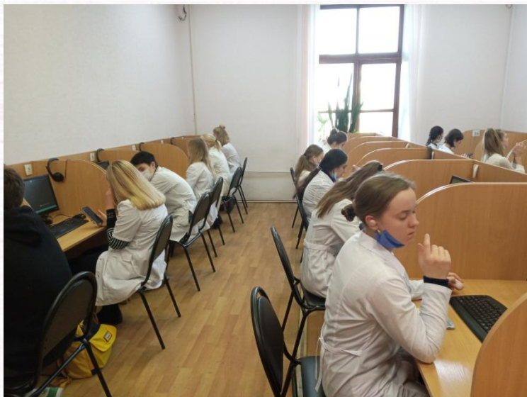
Цикл занятий «Здоровый я-здоровая родословная после меня»

«Люди должны осознать, что здоровый образ жизни - это личный успех каждого» (В.В. Путин)