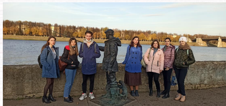
Студенты-фармацевты на экскурсии по набережной р.Волга