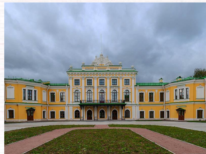
Тверской императорский путевой дворец — памятник архитектуры XVIII века