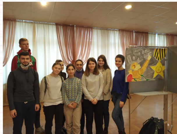
Студенты фармацевтического и педиатрического факультетов на выставке творческих работ «ВОВ глазами иностранных обучающихся Тверского ГМУ»