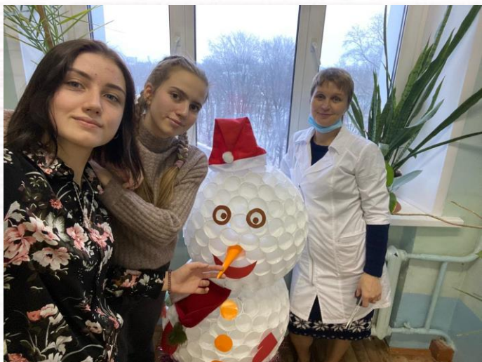
Креативное творчество студентов