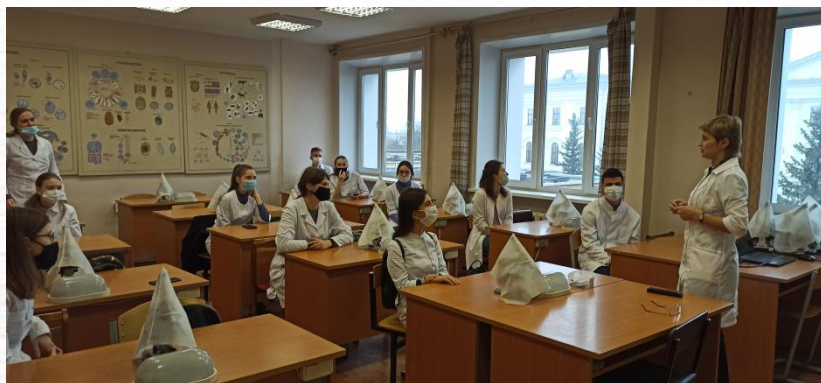
Кураторский час «Профилактика коронавирусной инфекции»