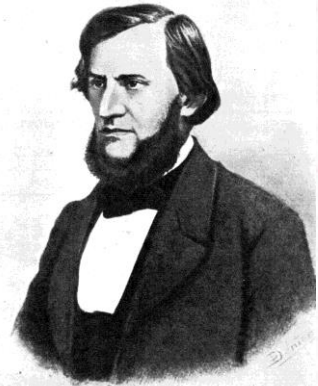
К.Д. Ушинский (1824-1870)

Искусство воспитания имеет ту особенность, что почти всем оно кажется делом знакомым и понятным, а иным - даже легким, и тем понятнее и легче кажется оно, чем менее человек с ним знаком теоретически или практически