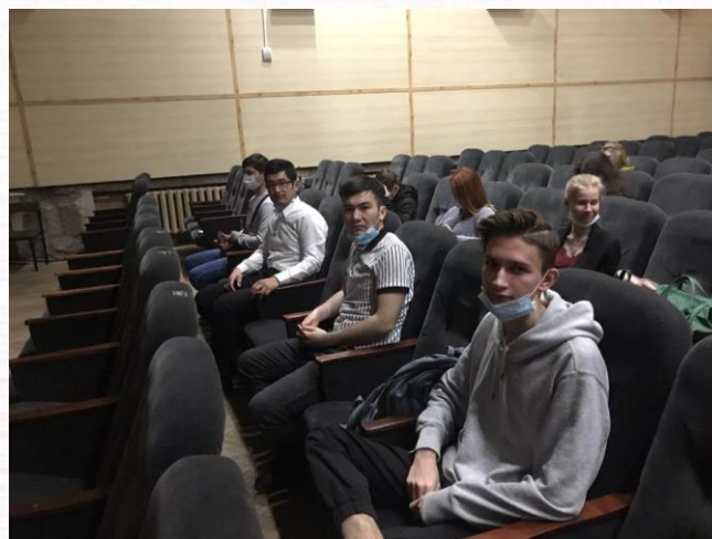
Участие студентов фармацевтического факультета в социальном проекте « Дети поколения Z. Время жить» с выступлением представителя УМВД России по Тверской области на тему «Противодействие идеологии экстремизма и терроризма в молодёжной среде»