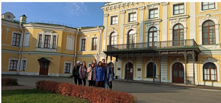
Экскурсия в Тверской императорский путевой дворец