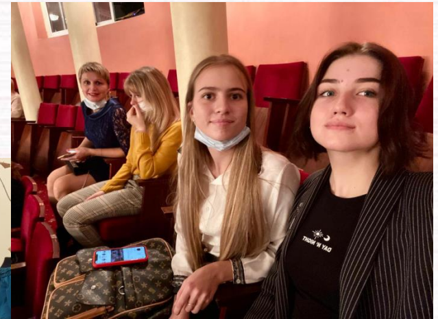
Студенты педиатрического факультета в Тверском академическом театре драмы