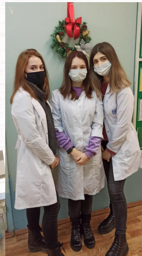
Украшение кафедры биологии студентами фармацевтического факультета к Новому году