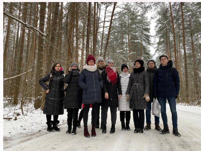
Студенты-педиатры на экскурсии в зимнем лесу