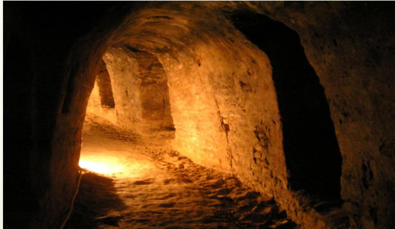
Ходы под особняком.