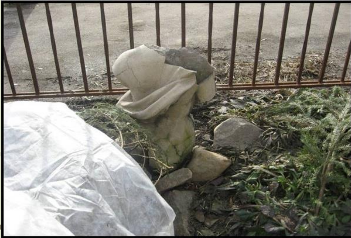
Остатки мраморной фигурки ангела, ранее украшавшей фонтан. 2016 год.

Фасад украшали каменные ангелы и вазы, в фойе посетителей встречали два огромных рыцаря в железных латах. Посреди дворика был устроен небольшой, но очень красивый фонтан с каменной скульптурой.