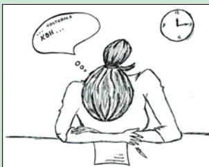
Ночь корреспондента. Рис. Я. Никитиной.