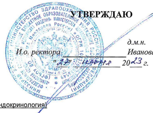
График одобрен Ученым советом вуза Протокол № 8 от 27.06.2023