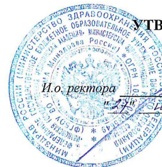
График одобрен Ученым советом вуза Протокол № 8 от 27.06.2023