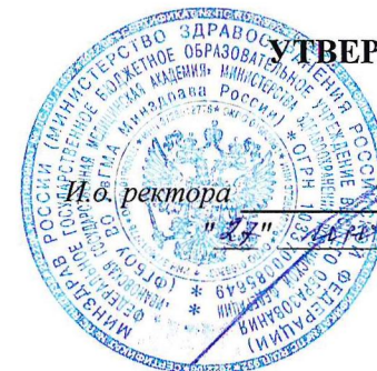
График одобрен Ученым советом вуза Протокол № 8 от 27.06.2023