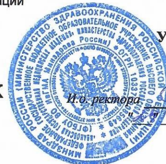
График одобрен Ученым советом вуза Протокол № 7 от 24.05.2022