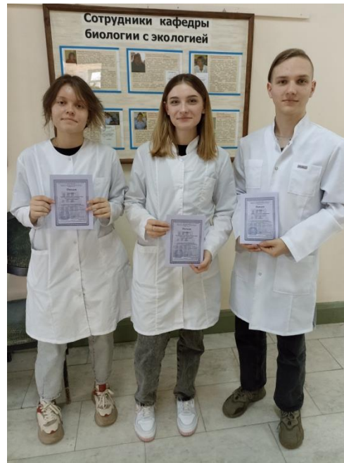
Участники, победители и призеры конкурса постеров в группах первого курса.