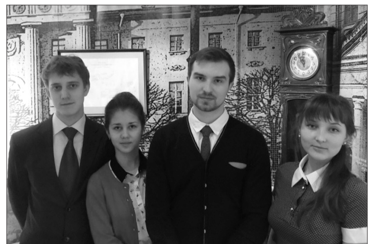
Студенты ИвГМА в музее истории медицины

До начала конференции гости МГМУ им. Сеченова посетили с экскурсией университетский музей истории медицины, которому в этом году исполнилось 25 лет.