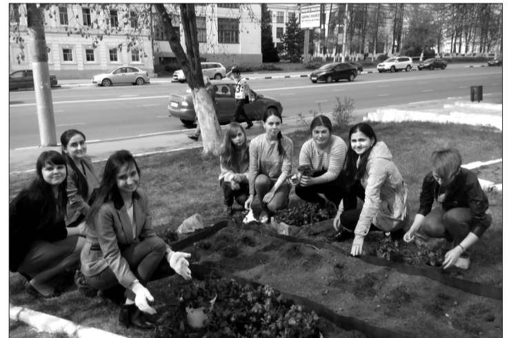
В преддверии 9 мая волонтеры «Экодесанта» (студенты 1–3 курсов) посадили клумбу у мемориала медицинским работникам – участникам Великой Отечественной войны.