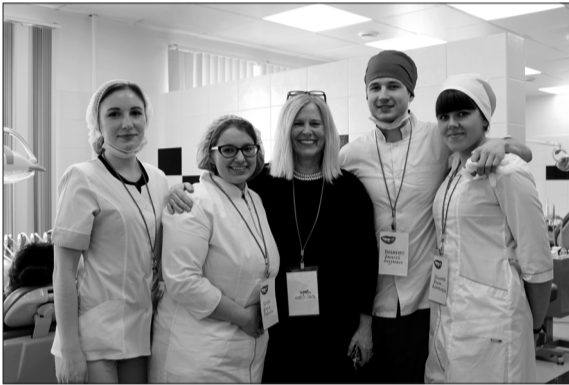
Студенты ИвГМА перенимают мировой опыт