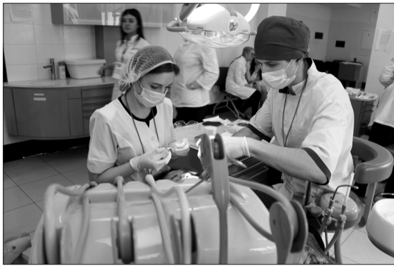
Пациент остался в восторге

У каждой команды был свой пациент (для кого-то – первый в жизни). До процедуры отбеливания проводилось строгое определение цвета зубов под