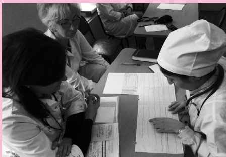
«День первокурсника» в 2011 и ответ на выпускном экзамене в июне 2017. Прошли шесть лет...