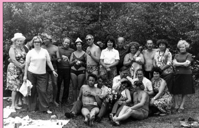
Встреча курса на лоне природы, 80-е годы.

Мы с искренней благодарностью и огромной признательностью вспоминаем настоящую газету «Медвузовец», на страницах которой отражались наши встречи.