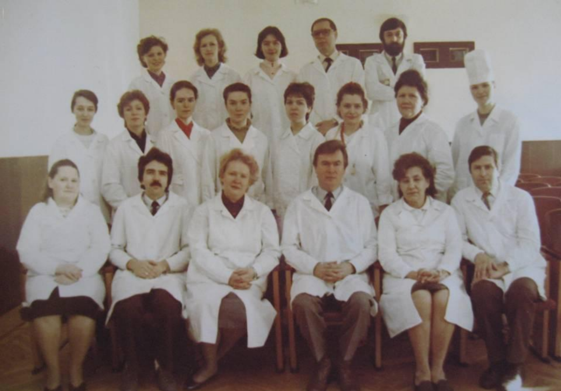
Кафедра детских болезней педиатрического ф-та. 1990 г.