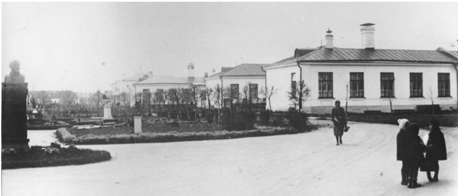
Первая городская больница

Руководство Первой городской больницы так оценивали её работу – «серьезный, вдумчивый врач, с хорошей подготовкой – является квалифицированным педиатром, способным самостоятельно решать не только вопросы лечения больных детей, а и вопросы организации обслуживания детства. Спокойная, ровная по характеру, она умеет хорошо организовать коллектив на выполнение поставленных задач. Дисциплинированная, энергичная, требовательная к себе и подчиненным. Систематически работает над повышением своей квалификации, читает всю новую специальную литературу, выступает с докладами и в прениях на научно-практических конференциях, является активным членом научного общества. В лечении больных детей – использует все новейшие методы лечения. Много внимания и времени уделяет воспитательной работе с персоналом, проводя с ним специальные занятия. Активно участвовала в общественной жизни больницы, являясь членом МК, членом редколлегии стенной газеты, членом смотровой комиссии, агитатором на участке».