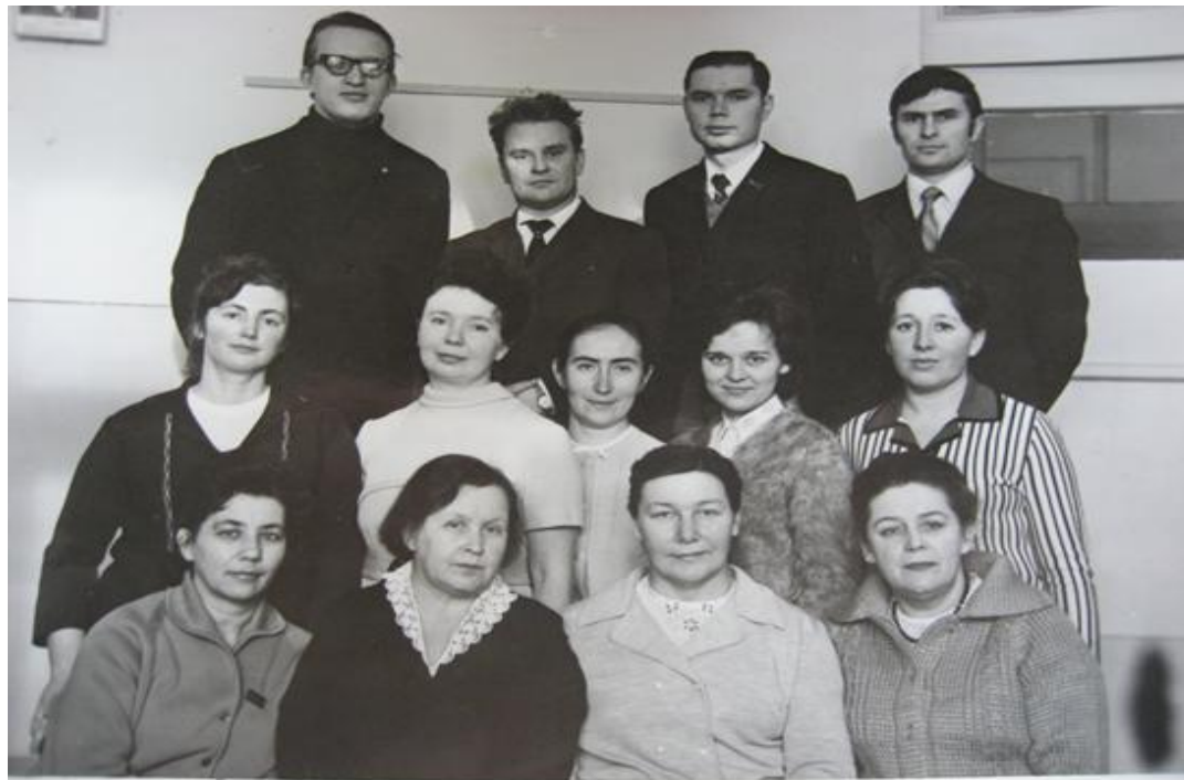
Коллектив кафедры детских болезней педиатрического факультета в стенах детской клиники 1 городской больницы (1971 год)