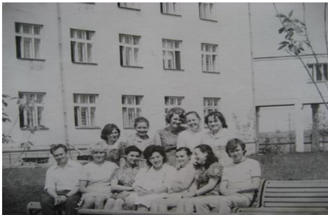
У 4 корпуса ОКБ перед государственными экзаменами (май 1972)