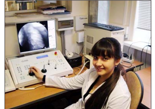
2 место.