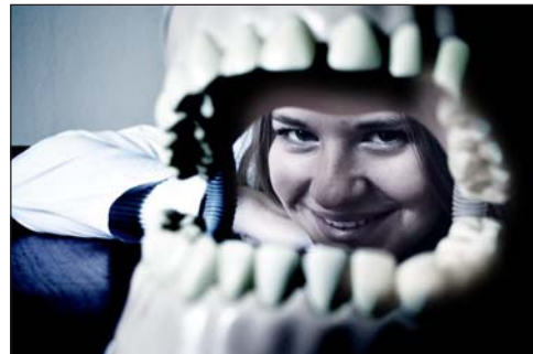
3 место.