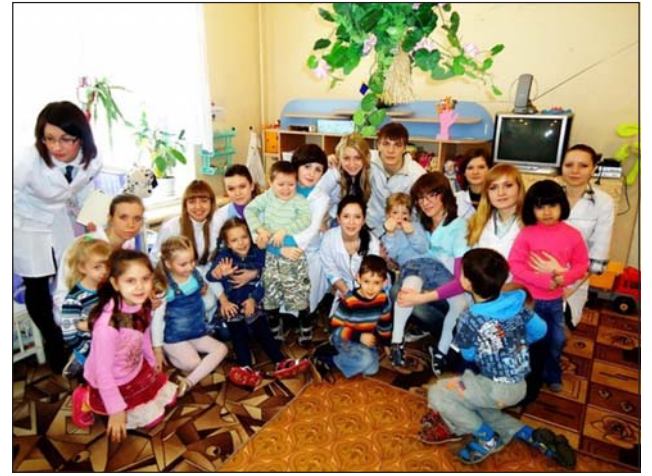
1 место.