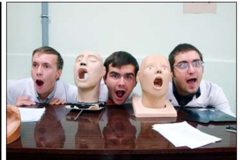
В десятке лучших.