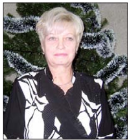
дировала все подшивки газет, вышедших начиная с 1957 года — года второго рождения