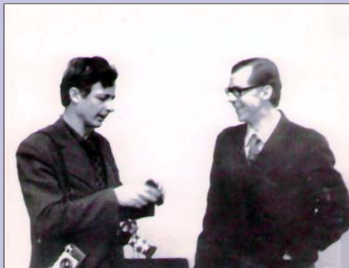
Учитель и ученик перед ответственной съёмкой.