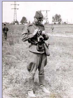
1975 г. Фотокорреспондент на военных сборах.