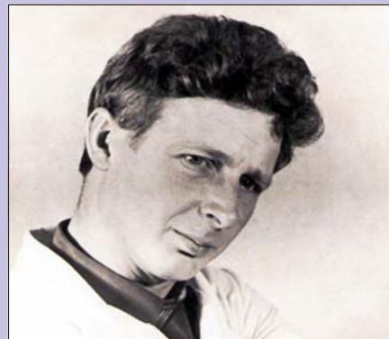
Портрет А.Ф. Богомоллова.