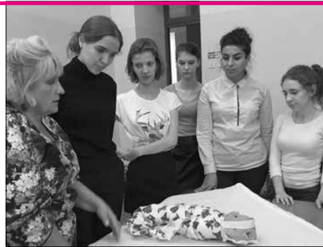
Дети чувствуют добро. Оно вселяет в них надежду на лучшее, прекрасное.

Маленькие, нежные ручки, тянущиеся к тебе, чтобы обнять крепко-крепко, насколько это возможно; радостный, звонкий смех; счастливая улыбка на лице – думаю, все это в полном объеме восполняет немного потраченного личного времени.