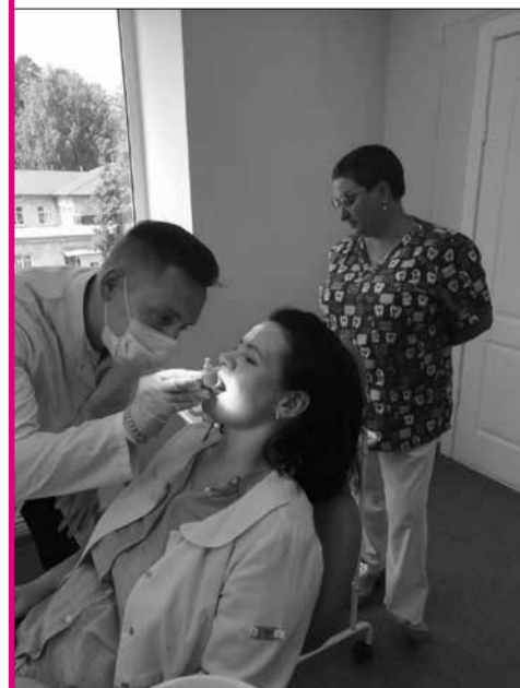
Студенты-выпускники на государственных экзаменах