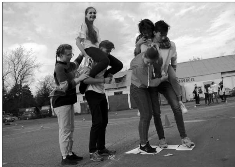
В рамках фестиваля первокурсников «Здравствуй, ИвГМА!» прошло фирменное мероприятие Совета студентов – командная игра «Мед-Боярд». На площадке автошколы ДОСААФ собрались 13 команд. Участникам пришлось осуществить непрямой массаж сердца, пройти через лабиринт и «лаву», ответить на вопросы блиц и «Крокодила», заняться перевязками... и многим другим!

Однажды мне сказали, что медицинское образование меняет людей, формирует их особенно, не так как остальных... что ж, надеюсь, у нас будет возможность это проверить. А пока мы можем только верить в это. Верить и учиться.