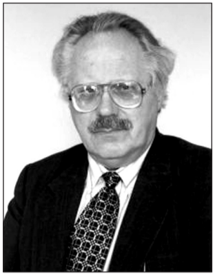
чётное звание «Заслуженный врач РФ».