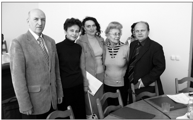
Члены диссертационного совета академии, 2007 г.

ми заболеваниями (2007-2011 годы)», Планом мероприятий по снижению смертности населения области от инсульта и инфаркта, который утверждён Постановлением Правительства Ивановской области, на территории региона в 2009 г. были открыты региональный и три первичных сосудистых центра. С учётом опыта ивановской неврологической школы, мирового опыта по оказанию помощи больным с острыми нарушениями мозгового кровообращения и существующей нормативно-правовой базы, коллективом преподавателей академии было разработано клинико-организационное руководство «Оказание медицинской помощи пациентам с острыми нарушениями мозгового кровообращения в Ивановской области». Руководство стало документом, регламентирующим междисциплинарное решение проблемы ОНМК в Ивановской области и